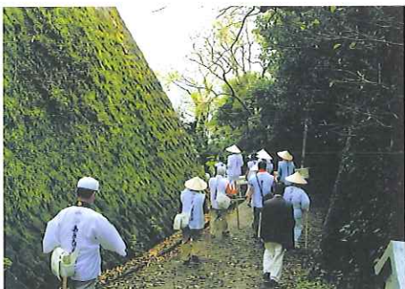
緑深い山道も歩きました(2010年春・第2回)

文化の奥深さを感じました。人は悩み、信仰の力で乗り越える努力をしてきた。それがお寺という場所。日本は素晴らしい国」と語ります。さらに「生きていく限り、いろんな方と話しながら、自分を磨いていくことが務め。『お陰さまで』の気持ちを大切に、これからもそうやって暮らしていきたいでしょう」と話してくださいました。