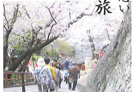
行き先々で満開の桜が...

文化の奥深さを感じました。人は悩み、信仰の力で乗り越える努力をしてきた。それがお寺という場所。日本は素晴らしい国」と語ります。さらに「生きていく限り、いろんな方と話しながら、自分を磨いていくことが務め。『お陰さまで』の気持ちを大切に、これからもそうやって暮らしていきたいでしょう」と話してくださいました。