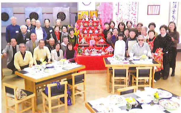
ひな人形が飾られた会場にて

参加者の約3割は男性で、新入居者の方の姿も。全員がユーモアたっぷりにスピーチをしたり、ひな祭りの歌を合唱したり、ちらし寿司や桜餅といった有志手作りの祝い膳を囲みながらの、おしゃべりが和やかに弾み