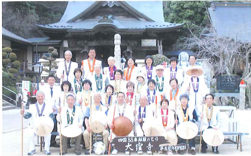
88番札所の大窪寺で記念撮影