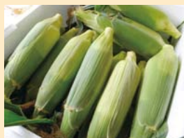
畑から直送の旬のトウモロコシも並びました。