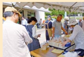
天然発酵パン「みんなの木」の焼きたてパンが到着!