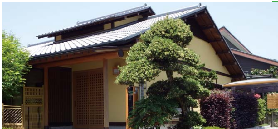
無料体験宿泊所「木木庵」は街の中の一軒家。街の暮らしを見るには絶好の場所にあります。