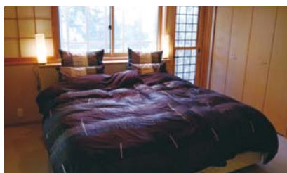
和室とはガラリと雰囲気の違いベッドルーム。

宿泊者には街内や宅地・中古住宅をご案内し、希望者はサークル見学へご案内いたします。