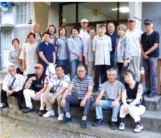
蛍鑑賞を前にたかき清流館で、参加者そろって記念撮影。

当日はまず、たかき清流館でお食事をいただき、夜のとばりがおりてきたころ、バスで黒川沿いに移動。現地に着し、さっそく川面へと降りていきます。今年は例年以上に蛍の姿が見られ、時折光る「クリスマスツリー」のような蛍の光には溜息がでていました。日本の美しい自然が残る、宝物のよ