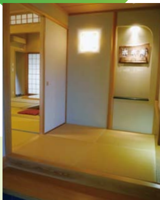
和風旅館のようなエントランス。