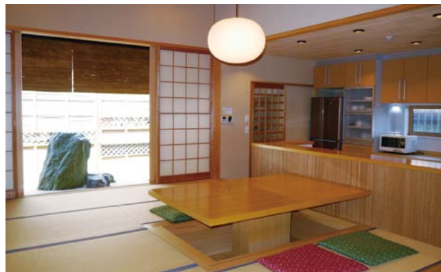
石庭を望める和室。キッチン是一段下がる京風の造り。