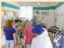
まとめ買いするファンも増えた YANAGA さん。