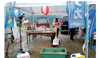
夏の情緒を盛り上げる「メダカすくい」。

美奈宜の杜が開設して20年。街が生まれた翌年から始まった「夏まつり」も、19回目の開催を迎えました。8月6日に開催された今年の夏まつりも、多くの住民さんとその家族の皆さんで盛り上がりました。 当日は午後から激しい夕立に見舞われ、開会までドタバタの準備となりましたが、夕立が幸いして夏まつりが始まるころには、涼しい風が会場に吹き、例年以上に過ごしやすい夏まつりとなりました。