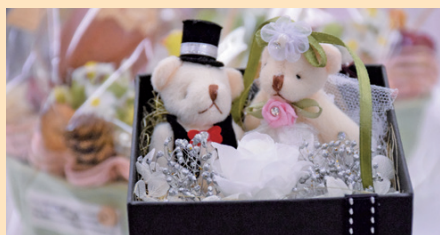
可愛い作品は、お見舞い用にと購入された方も。