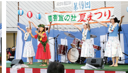
真夏の祭りにぴったりの「ハワイアンフラ」。