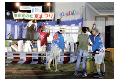
最後はお楽しみ福引大会。