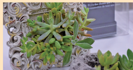
素敵なインテリアになりそうな多肉植物の作品。