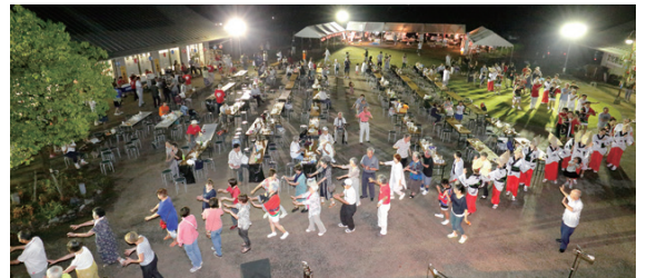
祭りのクライマックスは「炭坑節」の総踊り。