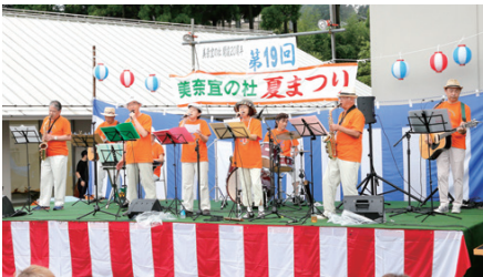
レパートリーが広がった「音づくりの会」。