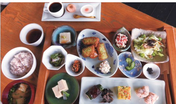
手作りデザート付きの「隣りのごはん」(1700円・税抜)。作り方を尋ねるお客様も多く、会話が弾むそう。

緩やかな傾斜を成す、緑あふれる敷地にギャラリーやカフェ、和菓子など6店舗を構える「ぶどうのたね」です。その空間は、自然が間近のテラス席や石積み演出が印象的。お昼は限定ランチ「隣りのごはん」を目標てに多くの女性で賑わいます。この日の内容は、トマトの白和えや野菜たっぷりのオムレツ、まるでお肉のような大豆の唐揚げなど全15品。野菜をこよなく愛する料理人が切り方一つからこだわり丁寧な仕事を施した料理は、食感も味覚も実に豊かです。他に薬膳カレーやパンランチ、季節のパフェやケーキなどのカフェメニューも。これにスタッフの気持ちのいい接客がプラスされ、ついつい長居してしまうのです。