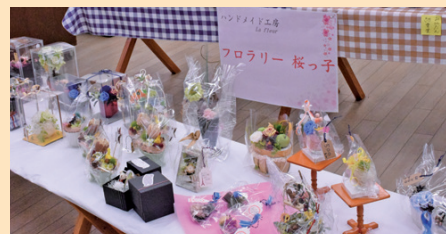
作者の個性が感じられる多彩な作品がいっぱい。