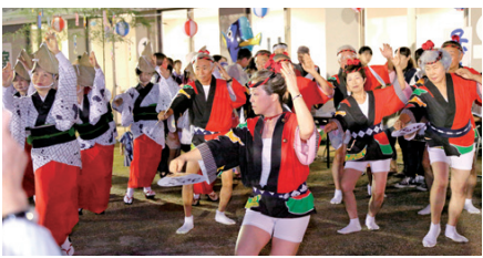
祭りを大いに盛り上げてくれた「ぞめきの日」の皆さんを中心とした、阿波踊り。