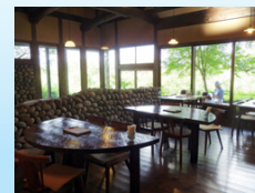
緑に囲まれた環境で、スタッフ自身が癒されているとか。

営業時間: 10:30 ~ 17:30 (ランチ11:30 ~ 15:00頃) 定休なし 駐車場あり (50台) 美奈宜の杜からうきは市方面へ車で約38分。中千足交差点で県道52号線へ進み、約800mを右折、県道151号線に入り約800m先を左折