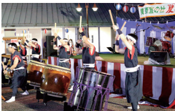
「あさくら橘太鼓」の皆さんの情熱的な太鼓演奏。