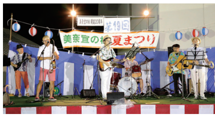
夏まつり名物の「たのくまバンド」が祭りをいっそう盛り上げます。