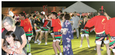
総踊りに子どもたちも参加しました。

美奈宜の杜で育つ子どもたちも増え、元気なパワーが街にあふれてきています。さらに、住民の皆さんのお孫さんたちにとって、この街は第二の故郷。夏休みやお正月のたびにこの街で過ごす時間は、日本の古き良き近所づきあいや伝統、文化を体感する、またとない機会となっています。夏まつりでは、地元の子どもたちに加え、おじいちゃん、おばあちゃんのを訪れた子どもたちの明るい笑い声に包まれ、真夏の街は幸せな雰囲気にも包まれました。