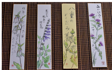
初めて描いたとは思えない見事な短冊作品

作品展を訪れた住民の方は、二年で随分見ごたえある作品が描けるようになるですね」と感心しきりでした。今後も、形式にとらわれない自由な作風の素晴らしい作品がたくさん生まれそうです！