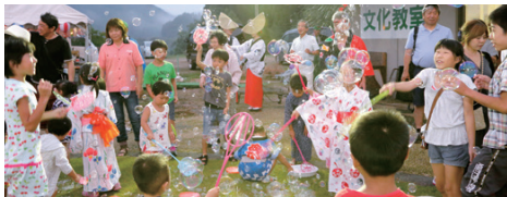
子どもたちが夢中になった「しゃぼん玉遊び」。