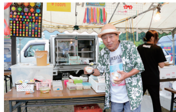
おなじみのつつちゃんの露天には「水まんじゅう」が登場。