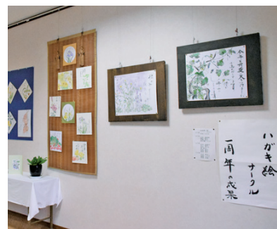
16人の個性あふれる作品が壁いっぱい