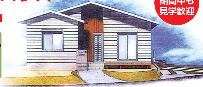
完成予定イメージパース図。

お問い合わせ・資料請求 美奈宜の杜販売センター フリーダイヤル ☎ 0120-005-337