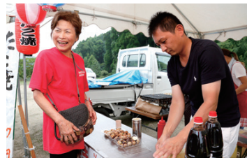
タコ焼きやから揚げ、焼きそばなどがテントの露天に集合!