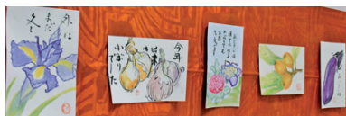
小さなはがきの中に季節を多彩に表現