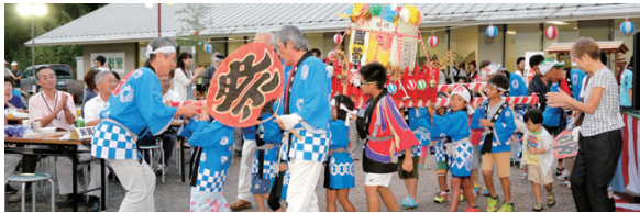
明るい歓声に包まれた「子供みこし」が会場を練り歩きました。