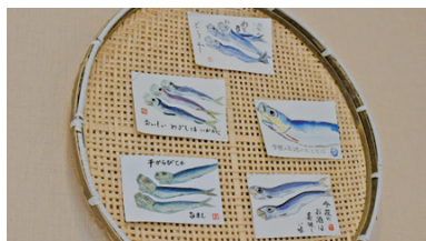
魚のはがき絵をザルに展示する粋な演出