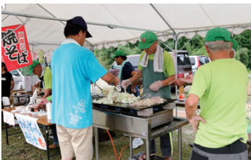
ソフトボール同好会の皆さんは「焼きそば」を販売!