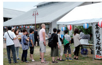
高木ジャンボ焼き鳥には、今年も長い行列が!