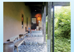
友人宅にお邪魔するように、入口で靴を脱いで店内へ。