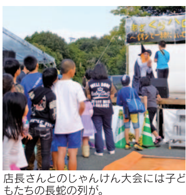
店長さんとのじゃんけん大会には子どもたちの長蛇の列が。