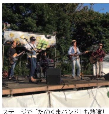
ステージで「たのくまバンド」も熱演!

会場には、イオン甘木ショッピングセンターの店長さんも仮装で登場し、子どもたちの人気を集めていました。また、会場内には「あさくらグルメ村」が集合し、美奈宜の杜でおなじみの「菓子処つつちゃん」「高木ジヤンボ焼き鳥」などが並び、多くの人が舌鼓を打っていました。