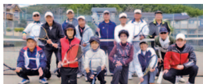
今回は女性4名の選抜メンバーが招かれました。

試合は、ラブゲームあり、接戦ありで大盛り上がり。コートの中も外も終始和気あいあいとした雰囲気の中、晴らしい大会でした。