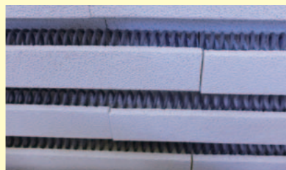
安全設計のコイル式ヒーター線。

陶芸教室で使用している窯が新しくなりました。昨年11月21日、コミュニティセンターの敷地内に新しく「三福陶芸窯」が設置されました。今までの窯と違うのは、外側がステンレス製になったこと。小型ながら断熱煉瓦を使った安全設計の電気窯です。26日にはさつそく初焼きも終了しました。陶芸教室は美奈宜の杜