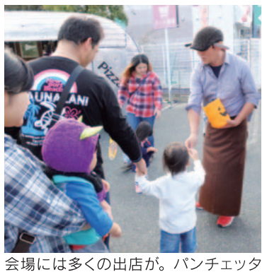
会場には多くの出店が。パンチエッタの移動ピザ窯も登場!

どが行われ、SUNRISE LIVEには美奈宜の杜でおなじみの「たのくまバンド」が演奏を披露。