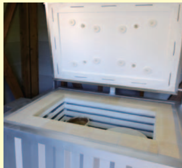
新釜での焼き上がりが楽しみです。