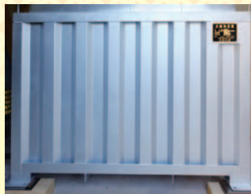
ピカピカのステンレス製。