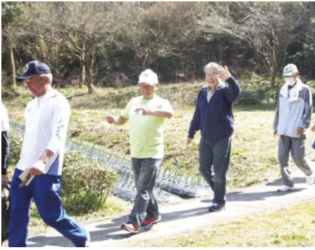
手を振りながら笑顔でゴール。