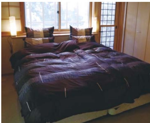
寝室はベッドだから、膝に負担がかかりません。

自然豊かなこの街には、短い時間を過ごす見学だけでは伝わらない何かがあります。豊かな緑や澄んだ空気、静かに流れゆく時間、人生を楽しむ住民の皆さん。無料体験宿泊は、そんな魅力を肌で感じていただく機会です。ガーデニング愛好家の方が多い美奈宜の杜は、初夏はもともと美しい季節。街内を散歩してお庭観賞を楽しみ、また住民の皆さんの生の声にも耳を傾けてみてください。