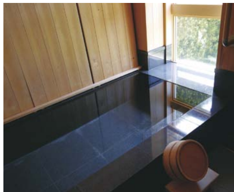
山林を望む浴室で何度でも温泉を楽しめます。

グ&キッチン、寝室のみのコンパクトな間取りはご夫婦二人暮らしの参考になると好評です。キッチンには食器のほかに電化製品等を用意しており、料理の持ち込みはもちろん、調理することもできます。自宅で過ごす感覚で「杜の暮らし」を体験してみてください！