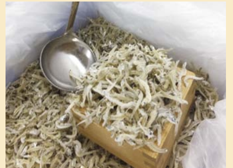
「藤の屋」にはカルシウムたっぷりの小魚類が！