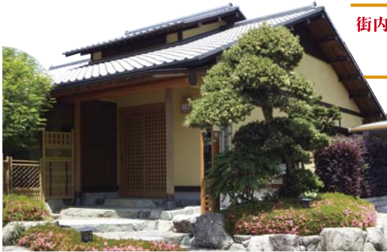
「木木庵」は街の中の一軒家。街の雰囲気を見るには絶好です。

宿泊者には 街内や宅地・中古住宅をご案内し、 希望者はサークル見学へ ご案内いたします。