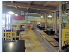
木造りの落ち着いた店内で極上のとんかつを。

住所：うきは市吉井町千年248 ☎：0943-76-5429 営業時間：11:30～14:30、18:00～20:30 (OS) 水曜日定休 駐車場30台 美奈宜の杜から国道386号線をうきは市方面へ。国道210号線「千年交差点」すぐそば。車で約25分。