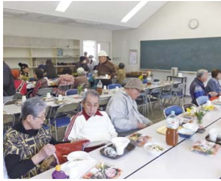
完歩後のお弁当は格別です。

さらに東京のテレビ局が取材に訪れ、参加者と一緒に完歩！取材した様子は、関東エリアでこの春放送されました。