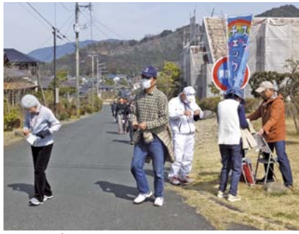
スタンプポイントで通過のシールを貼っていきます。