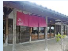
千年交差点すぐそばに位置する「レストラン庄山」。