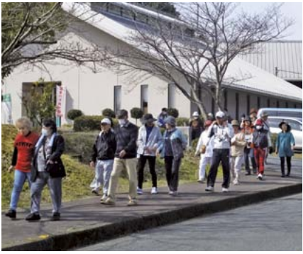
短距離コースの皆さんがスタート。

イベントでシールを貼っていきまが、そのシールを用意しているのも住民さん。住んでいる人たちが主役のイベントです。