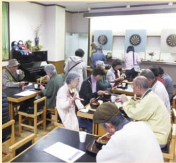
昼時には大賑わいの「杜のうどん屋さん」。