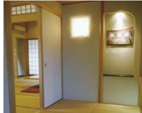
旅館のようなエントランスがすぐできます。

宿泊者には 街内や宅地・中古住宅をご案内し、 希望者はサークル見学へ ご案内いたします。