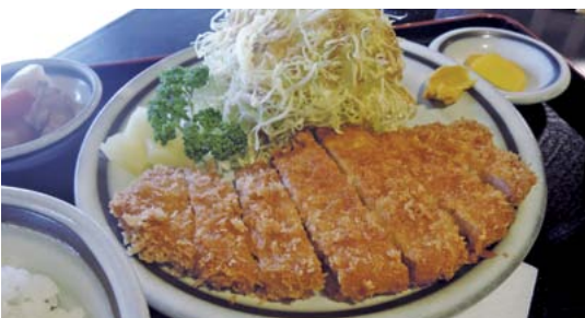
ボリュームたっぷりのとんかつ定食は1200円。甘みのある肉がジューシー。

手作り加工品もあります。お土産には、自家製のハムやベーコンのほか、特製ダレにつけた豚の生姜焼きなどの