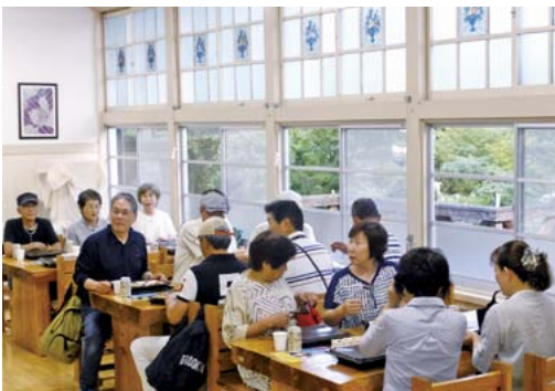
昨年、蛍鑑賞前「たかき清流館」での食事風景。