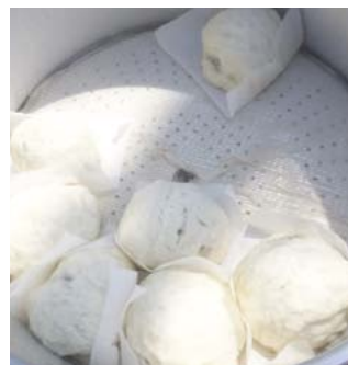
ゴールのあまぎ水の文化村交流広場には、おなじみのお店も。