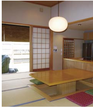
石庭の見える和室。キッチン是一段下がる京風の造り。

無料体験宿泊施設「木木庵」は、本格数寄屋造りの技と贅を尽くした日本家屋。温泉付きというのも大きな魅力です。和室リビンの