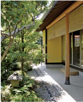
邸宅の庭も純和風。心和みます。

春の行楽シーズンを終えて少し落ち着いた頃。移住をお考えの方は美奈宜の杜の無料体験宿泊に來ませんか。お薦めもくあん」。純和風建築のすてきな温泉付き一戸建てで、言葉では伝えられない美奈宜の杜の魅力を感じてほしいのです。