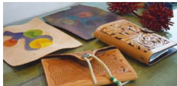
革の染色、レザーカービング(革の彫刻)などのレッスンも受付。革の魅力を堪能できます。