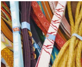
帯留めや帯締めなどの和装小物も豊富に揃っています。