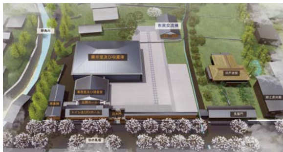
秋月博物館外観イメージパース

昭和40年の開館以来、地域の文化・歴史の発信基地としての役割を担ってきた朝倉市秋月郷土館が5月末に閉