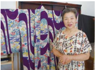
天然顔料による古代紫が艶やかな一番のお気に入りの着物の前で。