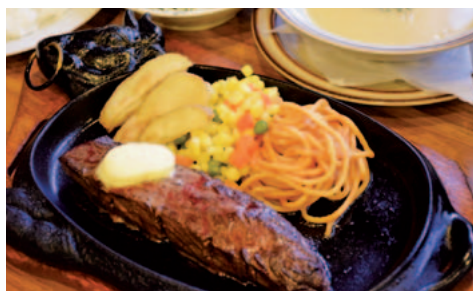
一番人気の「あら玉ステーキ」。200gのステーキに手作りのポタージュスープ、ワイン又はコーヒー、ライス又はパンがセットに。サラダには季節の果物まで付いて驚きの1840円。

ステーキと同じ肉で作られる贅沢なハンバーグのほか、カレー、カツ、パスタとメニューも豊富。870円からのお得なランチを夜も提供しています。現在は奥様と二人で切り盛りされているので予約がおすすぬ。「お客さんが喜んでくれるから」と手間を惜しまない愛情たつぷりの味に、心まで温まるお店です。