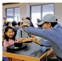
三世代でにぎわった「杜のうどん屋さん」。