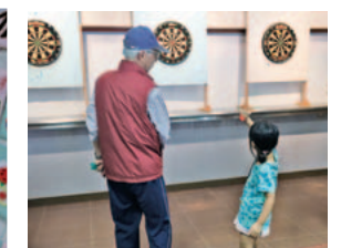
「当たった!」「刺さらない...」ダーツ体験で一喜一憂。