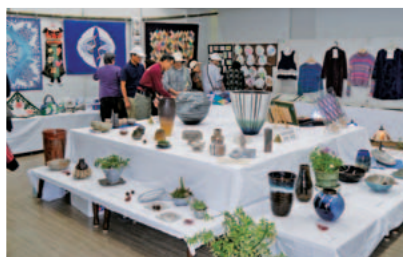
絵画や押し花絵、手芸品など力作が勢ぞろい。