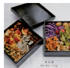
庭や近隣の草花で作った「花お重」。