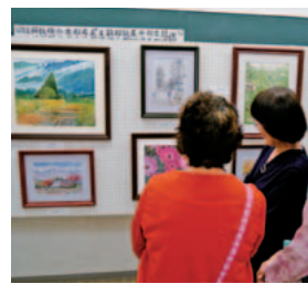
創作エピソードを話し合ったり、会話が弾みます。