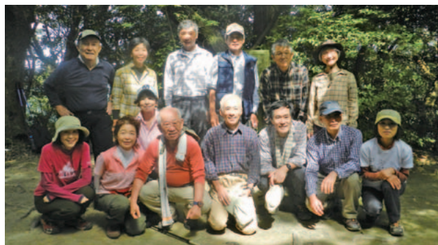
金立山で記念写真。

「自然の中で活動するのは気持ちいいもの。無理せず、できる限りクラブを続けていきたい」と皆さん。