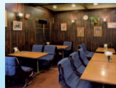
懐かしく落ち着ける昭和レトロな店内。壁には画家の息子さんの絵画も。

住所：福岡県朝倉市甘木1836 ☎：0946(22)1957 営業時間：12:00~14:30、18:00~20:30、不定休 ※おひとり様の予約も可 駐車場3台 美奈宜の杜から国道386号、県道112号を経由して約13分