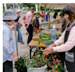
収穫の秋。旬の農作物が並びます。