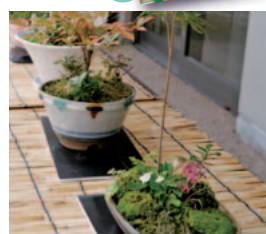
「ガーデンパートナー美奈宜」は盆栽に挑戦。