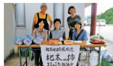
住民の皆さんは杷木の柿販売で復興を応援。