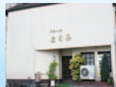
美奈宜の杜から車で約13分、恵比須町交差点すぐの一軒家レストラン。