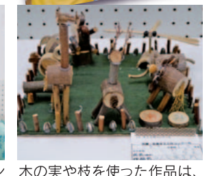
木の実や枝を使った作品は、子どもの発想が面白い。