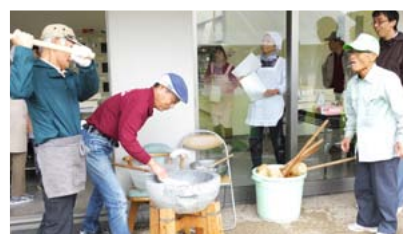
大好評の餅つき大会では、つきたての餅に舌鼓。