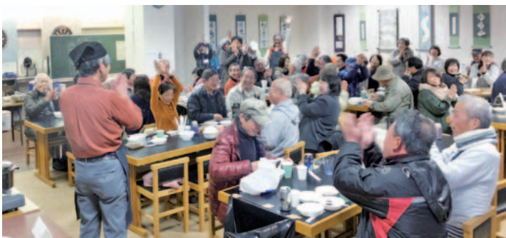
大盛況で、閉店になりました。「屋台村」に数々のごちそうを用意して下さった皆さん。