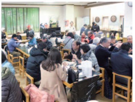
開店と同時に、大賑わいの会場。