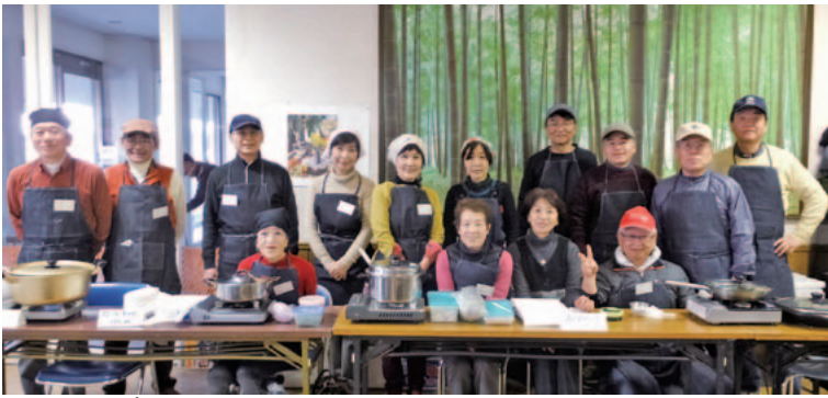
お揃いのエプロンで開店準備も気合い充分。

会場で食べるだけでなく自宅用に持ち帰ろうと保存容器を持参される方の姿も多く見られました。自慢の料理を持ち寄り、自ら販売、共にその味に舌鼓を打ちながら、語り合う：すべて住民さんが主人公というこのイベントも、すっかり美奈宜の杜の人気イベントに定着しました。来店する方はとぎれず、早々に完売になり大盛況のうちに閉店をむかえました。