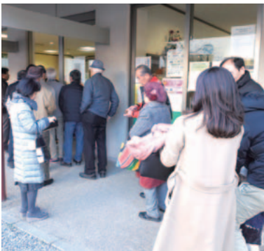
開店前から行列ができました。