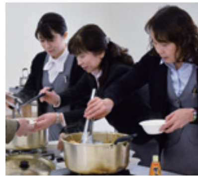
あったか〜いおでんは、西日本ビル女性社員たちが心を込めて前夜から手作りしたもの。