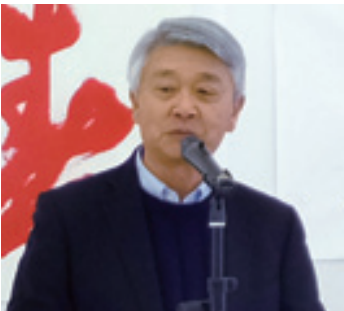
福元区会長の乾杯で、新年会の宴は、和やかにスタート。