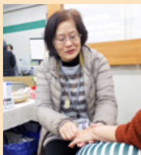
佐々野さんがハンドで行う施術は、イタ気持ちいいのです。