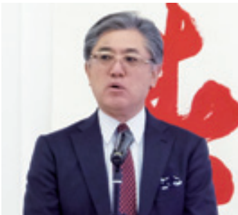
成年にかけ、「わんだフル」な年でありますように」と農塚社長。