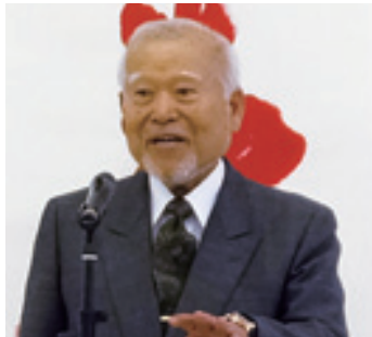
鶴田会長は、「安心して住める街にしましょう」と新年の決意をあらたに。