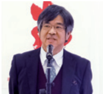
美奈宜の杜クリニックの麻生院長は高齢者の健康についてアドバイス。