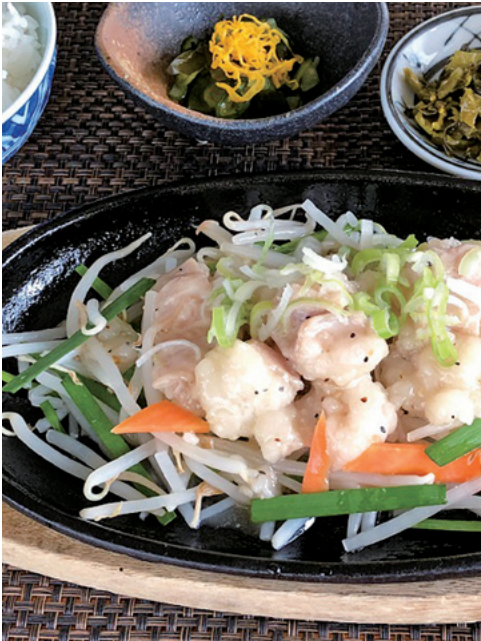
ご飯・小鉢・味噌汁・漬物付きのスタミナ塩ホルモンセット(税込1200円)。塩ホルモン焼き(税込880円)単品はぜひビールと一緒に。