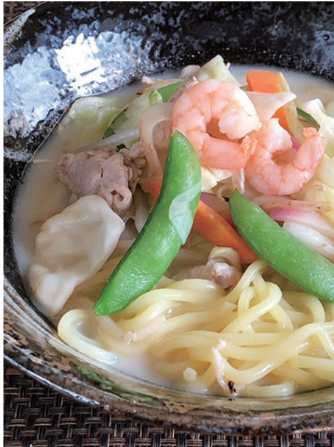
人気メニューのちゃんぽん(税込780円)が満を持して登場!たっぷり野菜のほか、豚肉、かまぼこ、エビと具だくさん。