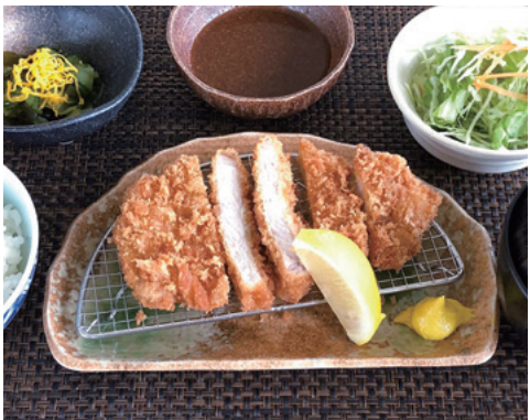
とんかつ定食(税込1080円)