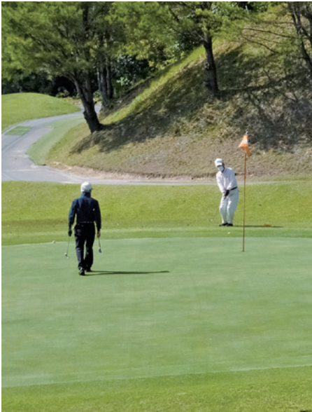
街内ゴルフ場 秋月カントリークラブ