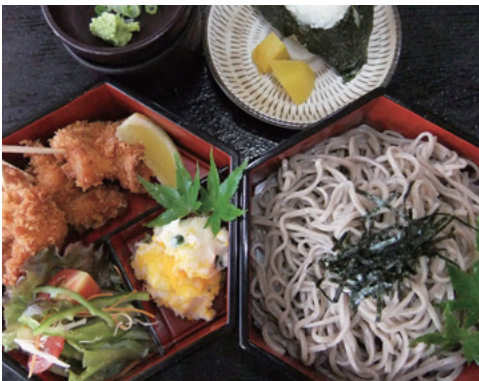
串揚げと蕎麦のお重(税込980円)