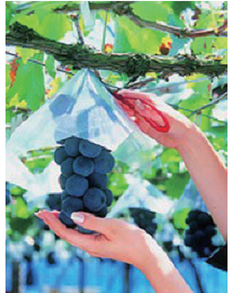
近隣農園 フルーツ狩り