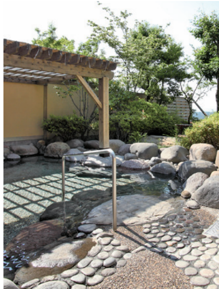
街内温泉施設 美奈宜の湯