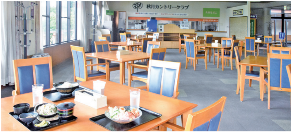
ゴルフコースの美しい緑を眺めながら食事できる開放感いっぱいの空間。