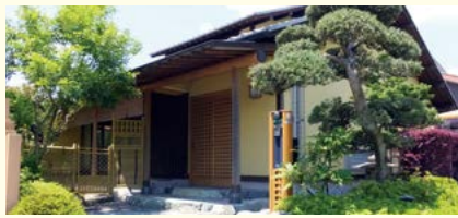
日本情緒にあふれた石造りのアプローチ。