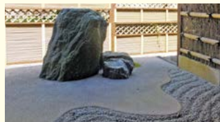
京風の石庭を望む和室で優雅なひとときを。

自然に恵まれた住環境と、温泉やゴルフ場などの施設が揃う「美奈宜の杜」。多くの住民の皆さんが心豊かに充実した日々を送る美奈宜の杜での暮らしを「無料体験宿泊」で体感いただけます。宿泊場所は、泉質が自慢の温泉付きで、京風の石庭が設えられた「木木庵」。平屋建2LDKの広々とした造りの空間で、ぜひ街の暮らしの魅力を感じてみてください。もちろん、ご家族での体験もOKです。